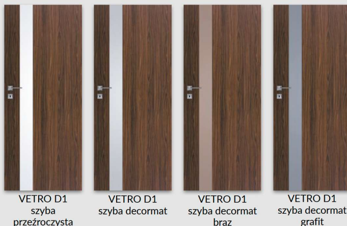
VETRO D1 szyba przezroczysta